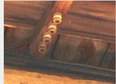
3 les plots