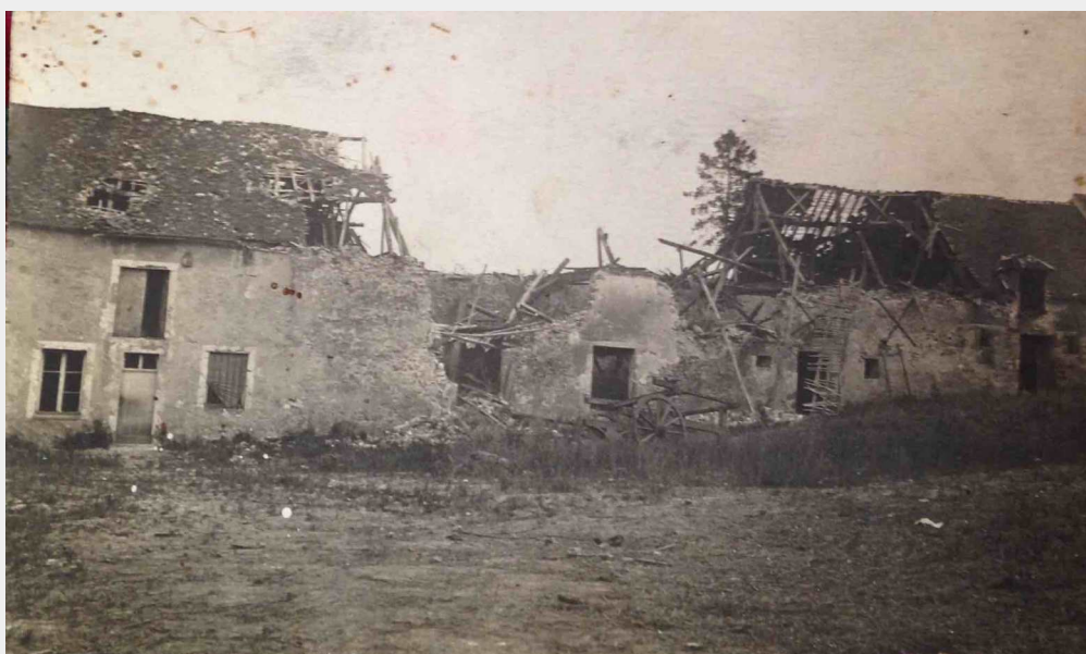
La ferme de la Charmoise en 1918

1920 8 avril Adrien Régnier achète la ferme en même temps que le moulin de la Charmoise, le tout nécessitant une sérieuse restauration, vu l'état des lieux après les combats de l'été 1918.