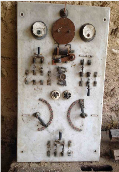
4 Le tableau de commande de distribution électrique