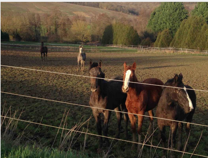
< Les chevaux à la Charmoise en 2020