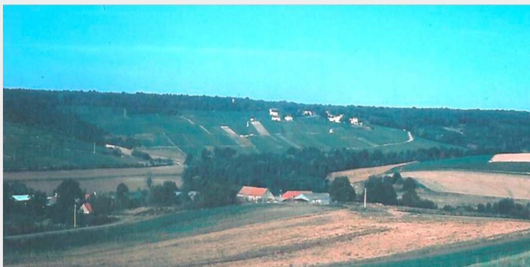
La Charmoise et Paradis sur les hauteurs nord du vallon de Cuchery-Belval

Au fond : le hameau de Paradis coincé entre les bois et les vignes. Au plan moyen : la ferme de la Charmoise.