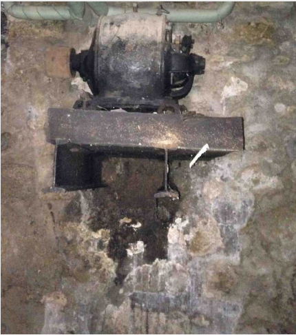
1 La génératrice

Elle recevait la courroie reliée à la turbine située dessous.