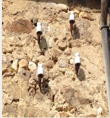
2 Les isolateurs en porcelaine

Elle recevait la courroie reliée à la turbine située dessous.