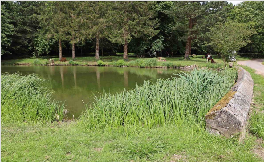
< La Grande Mare

Les maisons de La Neuville-aux-Larris ne sont pas bâties près d'un ruisseau, mais les habitants ont disposé de plusieurs puits, sources et fontaines. L'une d'elles, située sur des pâtis à quelques centaines de mètres du village, alimente la Grande Mare qui occupe une ancienne carrière communale ayant servi de routoir à l'époque où on cultivait le chanvre, puis plus tard de bassin pour tremper les joncs. Entretien ce site présente un coût pour la municipalité qui a cherché à en tirer des recettes, telle cette location de l'étang évoquée dans une archive communale de 1903.