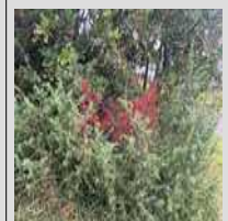
« Pétréots » sur les pâtis du Balai